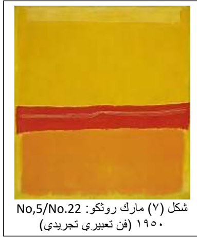
شكل (٧) مارك روثكو: No,5/No.22 ١٩٥٠ (فن تعبيرى تجريدي)

ويتجسد الخطاب أيضاً في اختيار المواضيع والمواقف التي يرغب الفنان في تسليط الضوء عليها، ويسهم الاختيار الفني للتقنيات والأساليب في بناء خطابات فنية جيدة، فيختار الفنان تقنيات التجريد لتوسيع مدى التعبير وتشويق المشاهد، أو يفضل الواقعية لنقل الواقع بدقة، ويعكس الخطاب في الفن التشكيلي عمق العواطف والأفكار، حيث يبني الجسر بين الفنان والمشاهد، يفتح أفقاً جديداً للتفكير، ويتيح فهماً أعمق للمجتمع والإنسانية، كما في شكل (٧).