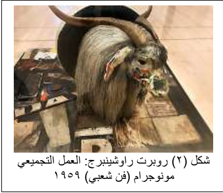
شكل (٢) روبرت راوشينبرج: العمل التجميعي مونوجرام (فن شعبي) ١٩٥٩

وعلاوة على ذلك فخطاب ما بعد الحداثة كان له الأثر الواضح في طريقة الاستهلاك التي اصبحت من السمات الواضحة لذلك العصر الجديد، فتمثلت النتاجات لتلك الحقبة فنياً، "وكانت خطاباتها تهكمية مليئةً بالسخرية والشظايا والأيدولوجيا من الغياب والانكسارات، واستدعاء لأشكال الصمت المعقدة والمنطوقة" (حسن: ٢٠١٨، ص ٢٢)، كما في الشكلين (١) و(٢).