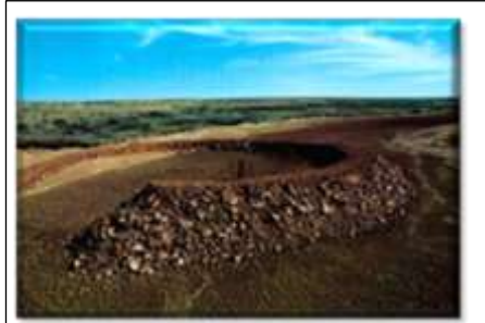
شكل (٤) روبرت سميثون: منحدر مدينة أمارليو (فن مفاهيمي) ١٩٧٣

وعليه، نذب الفنانون في فن ما بعد الحداثة المفاهيم الخطابية الفردية للفن وربطوها بدلاً من ذلك بالمجتمع، ليتواصل الفنان بأكبر قدر من الجماعات الإنسانية فيكونون قادرين على الاستيعاب التام ويتقبلون أي فكرة أو مفهوم أو أي تغييرات جديدة، (بالأخص بعدما دخلت التكنولوجيا في تحقيق الأعمال الفنية من خلال تطوير وإدخال التقنيات الجديدة، أي الحقبة التي تلت الحرب العالمية الثانية، والتي شهدت تحولاً كبيراً وسريعاً في طابع الثقافة الشمولية وخصائصها، فكانت ثمة موجة من النشاط النقدي لاستقبال النموذج الجديد في الفن) (بروكر: ١٩٩٥، ص ١٢)، كما في الشكل (٤).