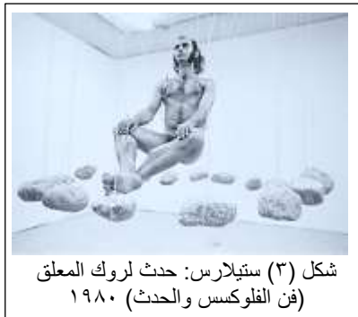
شكل (٣) ستيلارس: حدث لروك المعلق (فن الفلوكسس والحدث) ١٩٨٠

وساهمت القدرات المكتسبة للأشكال الوجودية المتنوعة في توفيقها بين الفنون المتنوعة بالحياة الإنسانية والتكيف مع العصر الصناعي وكذلك الغزو الإلكتروني الذي شهدته، فتأثيراتها الفنية تحتاج إلى نسيج ملموس من الخطابات الفنية المتنوعة، فلا توجد عبارات خطابية لا يمكن المساس بها أو التأثير فيها على المتلقي، فبدأ الفنانون بإلغاء كل حاجز يمنع بين الفروع الفنية المختلفة، فصارت المجالات الفنية تشكل مواضيعاً للنقاد والمتذوقين يتناولونها في الوظائف الفنية، "ولم تعد مسألة الصدق أساساً لهذه الخطابات، بل الأدائية القادرة على أن تسوّغ الأهداف الجديدة التي تُستخدم من أجلها، بغض النظر عن وجهة استخدامها" (ليوتارد: ١٩٩٤، ص ٦٣)، وأصبحت الخطابات الفنية لما بعد الحداثة تشكل نقدًا للأفكار أو المواقف أو لسياسات معينة، فضلاً عما كانت عليه في الحداثة وما قبلها عندما كانت تستجيب للاحتياجات العاطفية الإنسانية وتتأثر بها، فالخطابات الفنية مرت بعدة عمليات إنشائية لعمليات خطابية تواصلية مبتكرة يتواصل بها الفنانون في حياتهم اجتماعياً، كما في الشكل (٣).