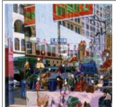
شكل (٥) دون ايدي: الأحذية الجديدة (الواقعية الجديدة) ١٩٧٣ - ١٩٧٤