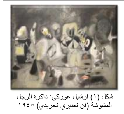
شكل (١) ارشيل غوركي: ذاكرة الرجل المشوشة (فن تعبيرى تجريدي) ١٩٤٥

وساهمت القدرات المكتسبة للأشكال الوجودية المتنوعة في توفيقها بين الفنون المتنوعة بالحياة الإنسانية والتكيف مع العصر الصناعي وكذلك الغزو الإلكتروني الذي شهدته، فتأثيراتها الفنية تحتاج إلى نسيج ملموس من الخطابات الفنية المتنوعة، فلا توجد عبارات خطابية لا يمكن المساس بها أو التأثير فيها على المتلقي، فبدأ الفنانون بإلغاء كل حاجز يمنع بين الفروع الفنية المختلفة، فصارت المجالات الفنية تشكل مواضيعاً للنقاد والمتذوقين يتناولونها في الوظائف الفنية، "ولم تعد مسألة الصدق أساساً لهذه الخطابات، بل الأدائية القادرة على أن تسوّغ الأهداف الجديدة التي تُستخدم من أجلها، بغض النظر عن وجهة استخدامها" (ليوتارد: ١٩٩٤، ص ٦٣)، وأصبحت الخطابات الفنية لما بعد الحداثة تشكل نقدًا للأفكار أو المواقف أو لسياسات معينة، فضلاً عما كانت عليه في الحداثة وما قبلها عندما كانت تستجيب للاحتياجات العاطفية الإنسانية وتتأثر بها، فالخطابات الفنية مرت بعدة عمليات إنشائية لعمليات خطابية تواصلية مبتكرة يتواصل بها الفنانون في حياتهم اجتماعياً، كما في الشكل (٣).